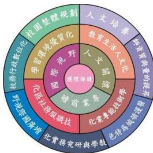
圖 2 豐富分類通識課程

整合科技智慧進行醫療照護的相關服務，包括社區志願服務理論與實踐、智慧行動居家照護、生命體驗課程及國際志工服務組織與實踐相互導引，跨「智慧健康醫療照護」及「文化導向生活科技」等領域之新興前瞻議題，激發學生對於醫療照護的想像與創意，進而可應用在真實的智慧健康照護服務模式上，整合科技智慧進行醫療照護的相關服務，要透過服務來學習，日本趨勢大師大前研一認為「專業即是以所學，使所處的世界更美好！」，清楚詮釋了「專業」應建立服務社會，造福他人，成就公眾最大利益的前提以及目標之下，才得以體現民主教育之成功。所以與本校之發展目標與特色不謀而合，